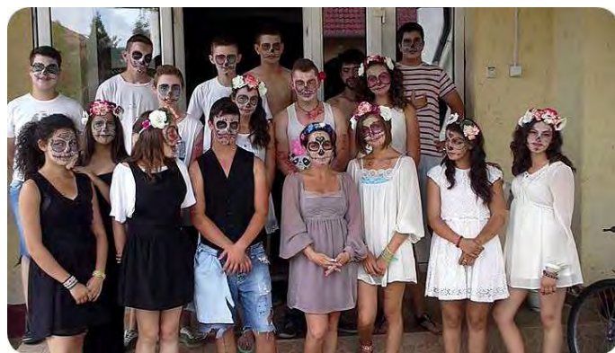
Itt még vidáman, önfeledten

A 8. osztályosok hagyományainkhoz híven ebben a tanévben is több ízben búcsúztak el intézményünkötől. Az iskolai időszak utolsó péntekén legnagyobb növendékeink fantasztikus hangulatú búcsúdiszko után szerenádra indultak tanítóikhoz, tanáraikhoz, majd az utolsó tanítási napon különleges öltözetben és gondosan elkészített arcfestéssel indultak iskolánk minden telephelyére és a vértesi településrész központi épületeibe vidám hangulatot varázsolni.